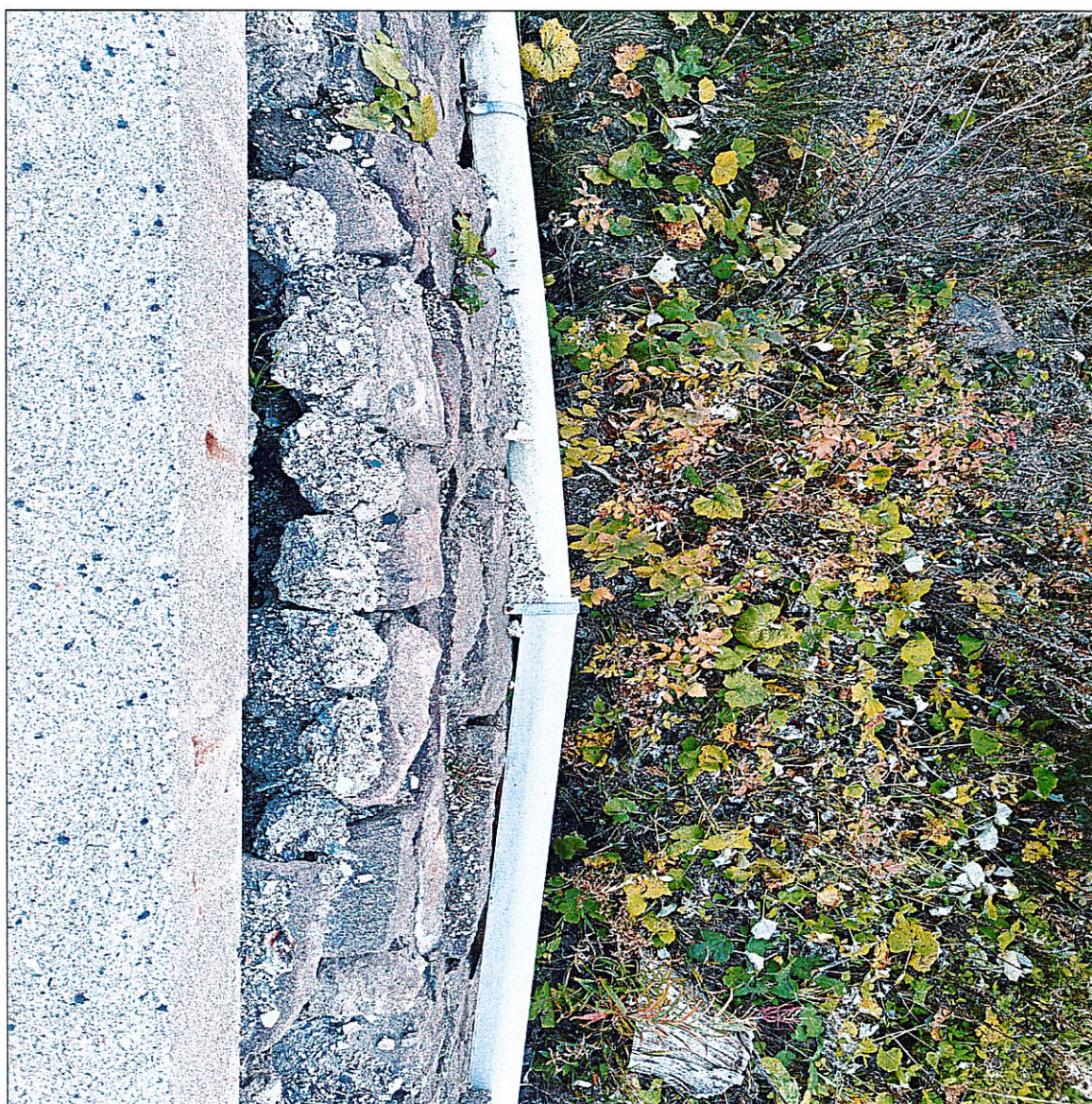
FOTO n. 5 – SS n. 620 del passo Lavazè dal km 13,400 al km 14,100