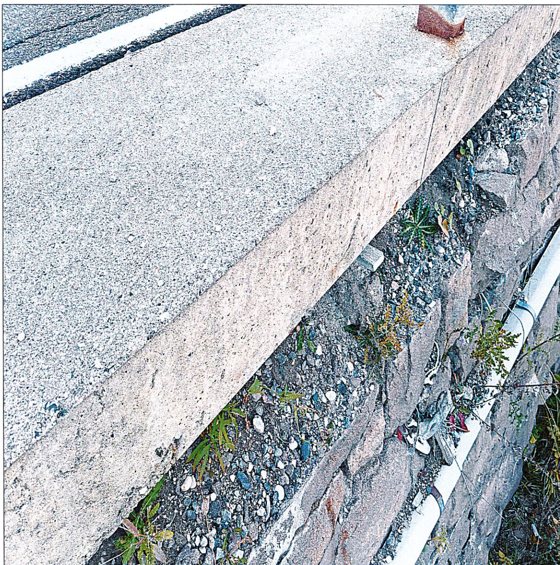
FOTO n. 1 – SS n. 620 del passo Lavazè dal km 13,400 al km 14,100

A handwritten signature in blue ink, consisting of stylized, overlapping letters.