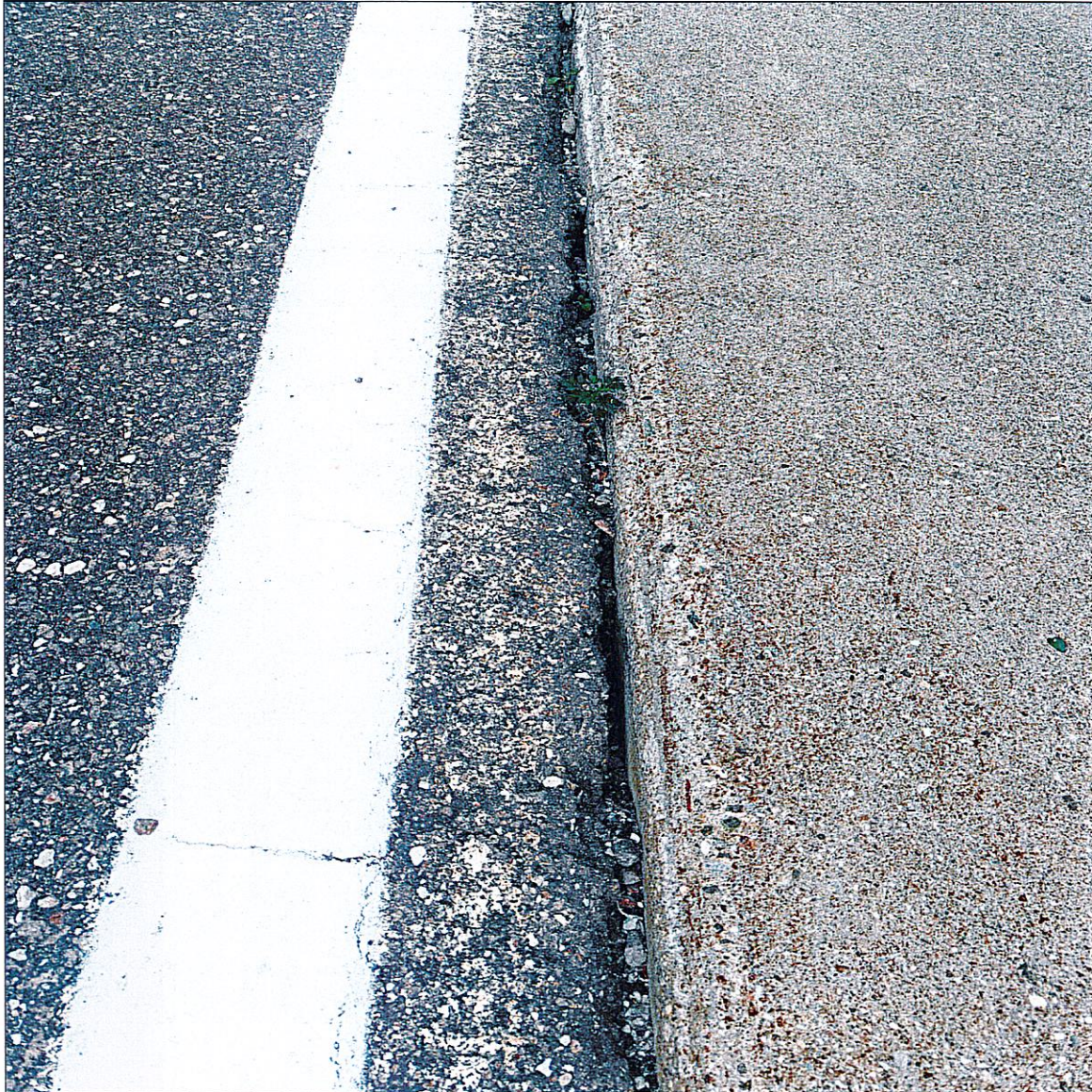
FOTO n. 2 – SS n. 620 del passo Lavazè dal km 13,400 al km 14,100