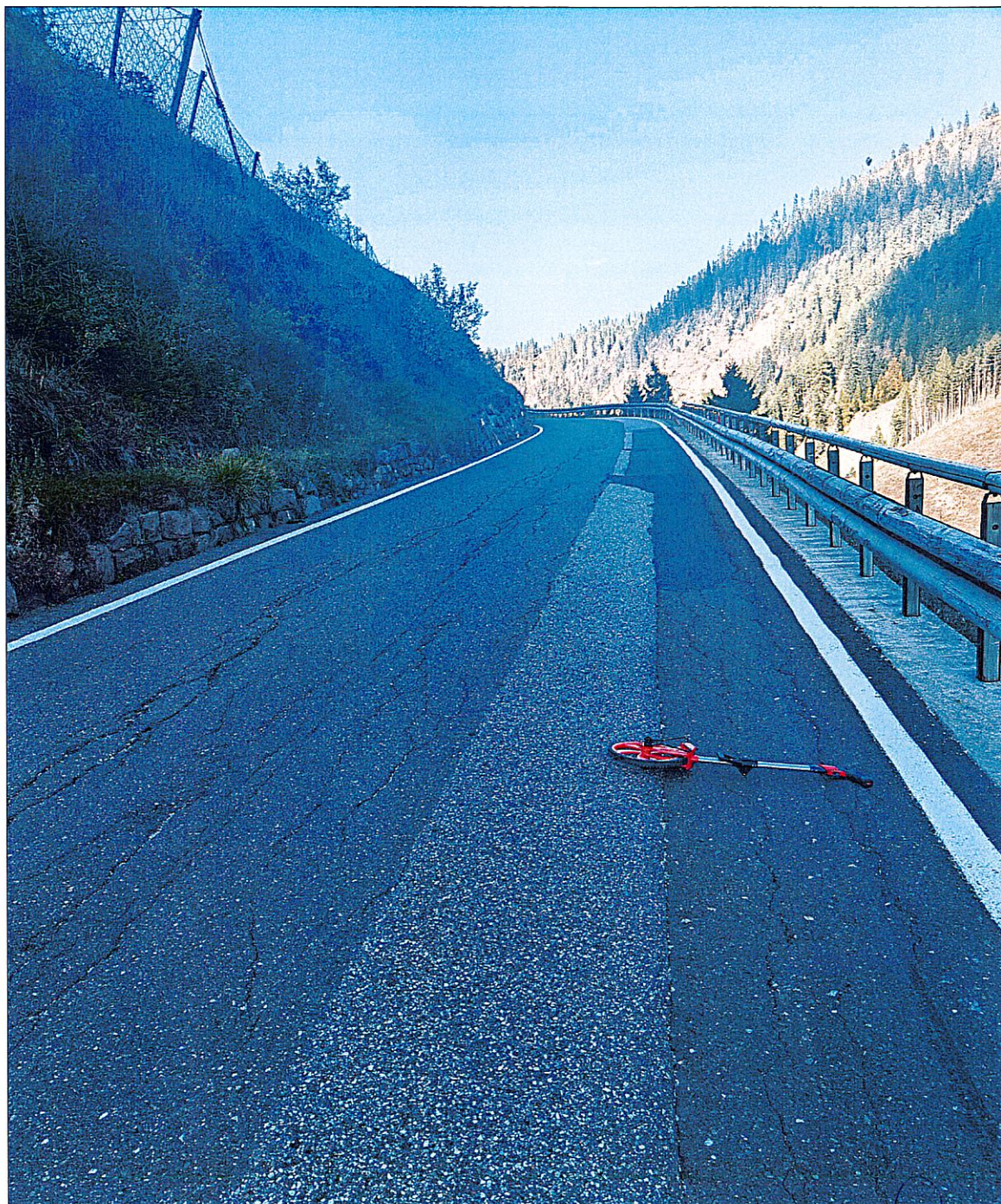
FOTO n. 3 – SS n. 620 del passo Lavazè dal km 13,400 al km 14,100