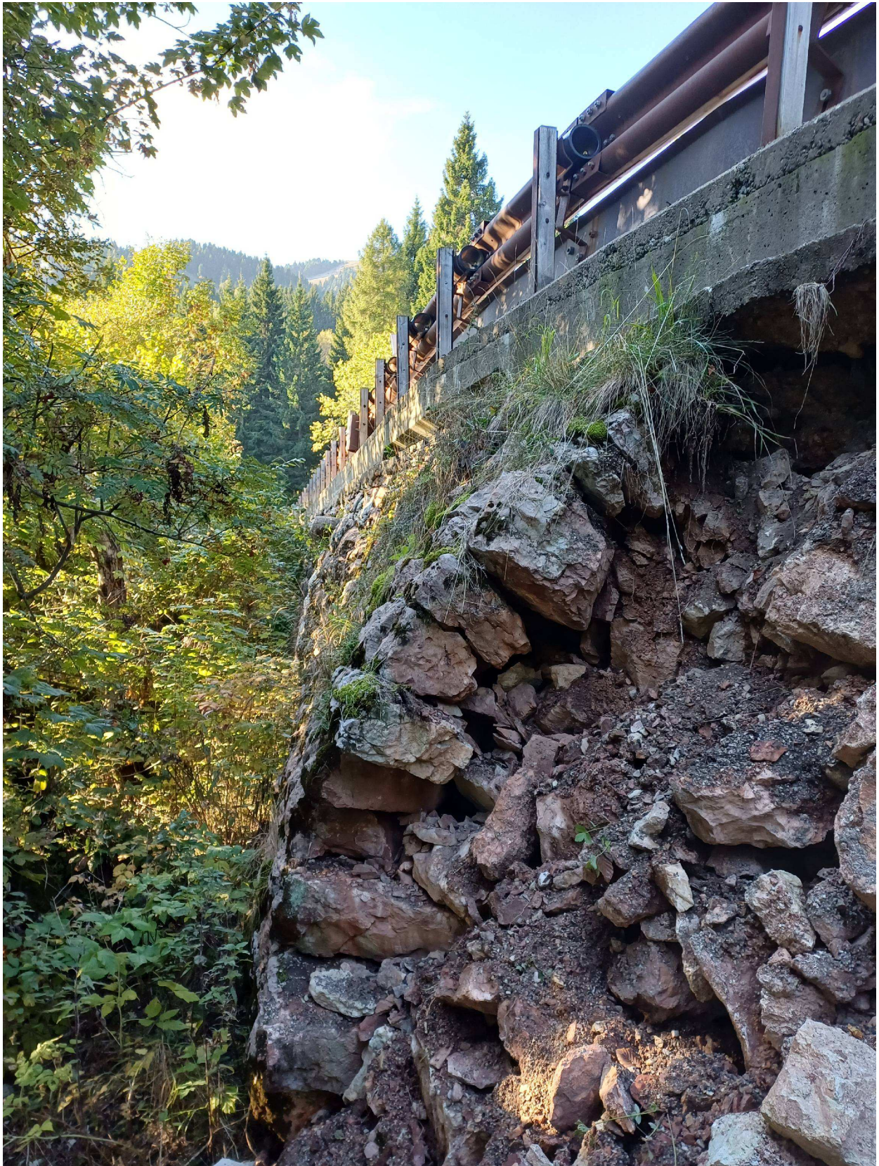
Foto n. 3 – Particolare della porzione di muro esistente in precarie condizioni statiche.