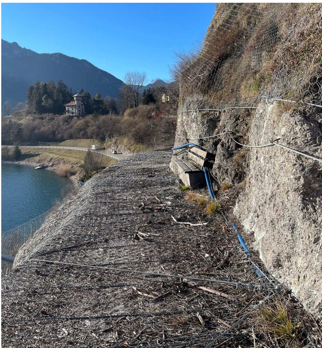
Foto n. 2 – Vista della porzione centrale del tratto del percorso ciclopedonale interrotto.