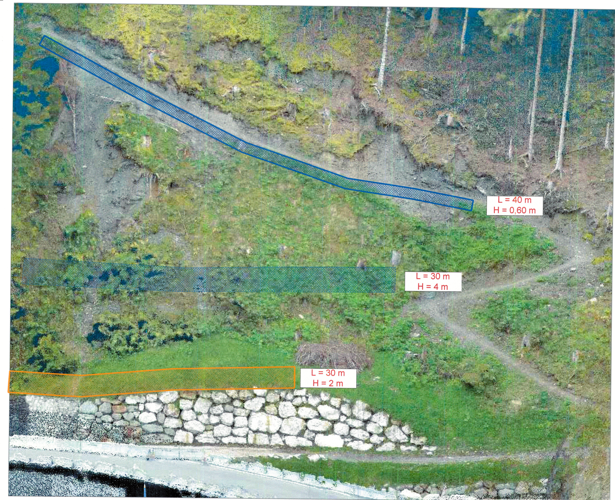
VISTA AREA FRANA