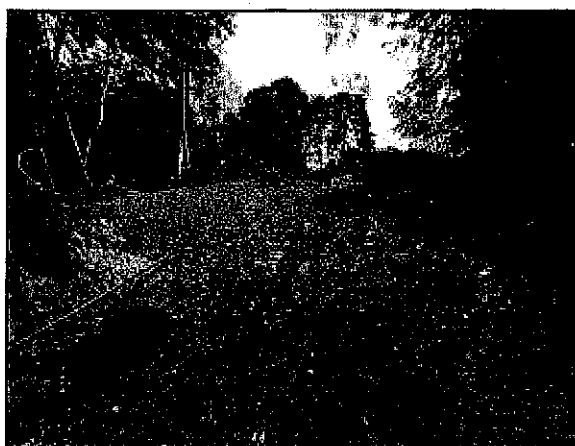
FOT.2 - Vista fronte di frana dal basso- estensione circa 15 m (larghezza) per 30 m (lunghezza)