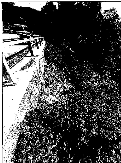
FOT.2 - Fronte da consolidare - vista da monte