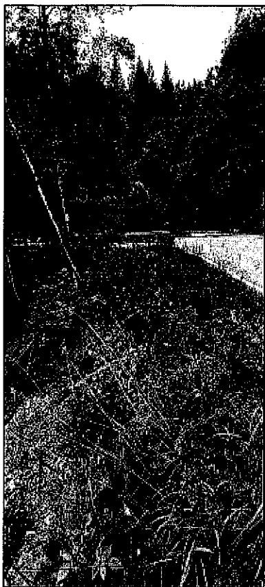
FOT.1 - Ciglio superiore fronte frana SP115 - distanza dalla strada

INTERVENTO 1- SP115 ' DI SAGRON MIS' IN PROSSIMITA' DEL KM 1+500