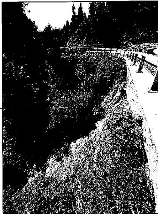
FOT.1 -Fronte di dilavamento scarpata con particolare dello scalzamento del muro e delle gabbionate esistenti svuotate dietro