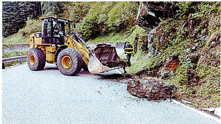
Foto 4- Immagine distacco ammassi rocciosi - particolare