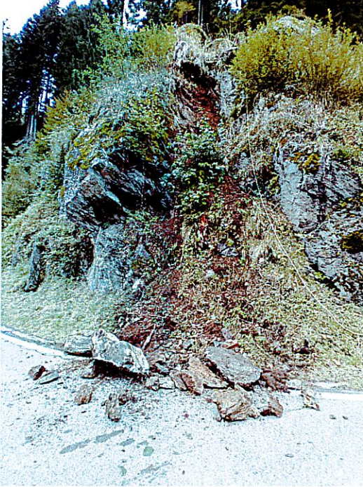
Foto 1- Immagine distacco ammassi rocciosi intervento 1

INTERVENTO 1 – Zona di monte SS50 km 83+400