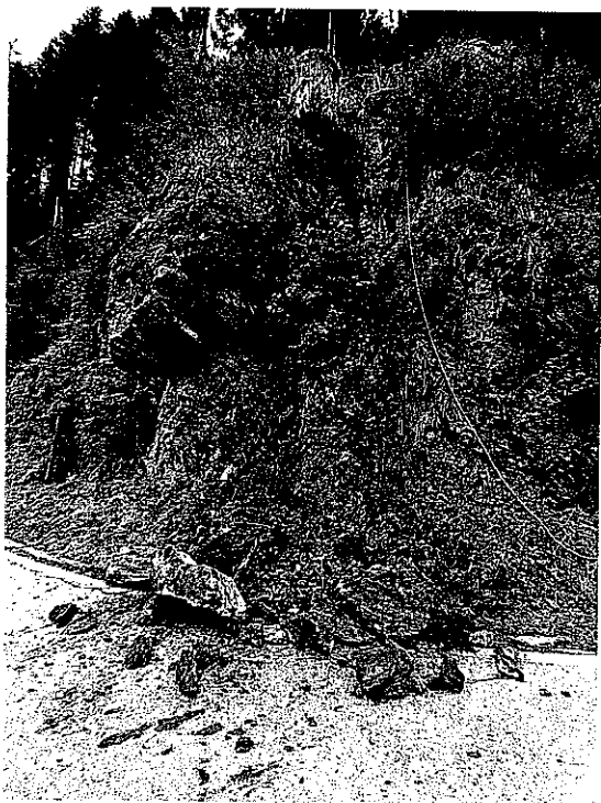
Foto 1- Immagine distacco ammassi rocciosi intervento 1

INTERVENTO 1 – Zona di monte SS50 km 83+400