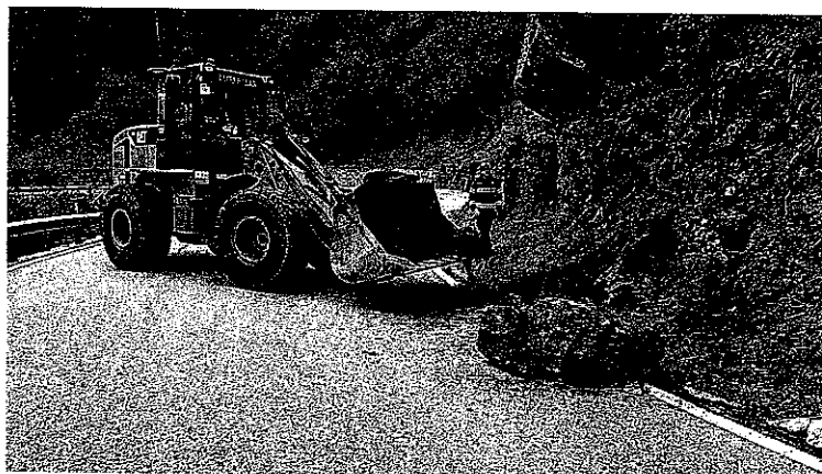
Foto 4- Immagine distacco ammassi rocciosi - particolare