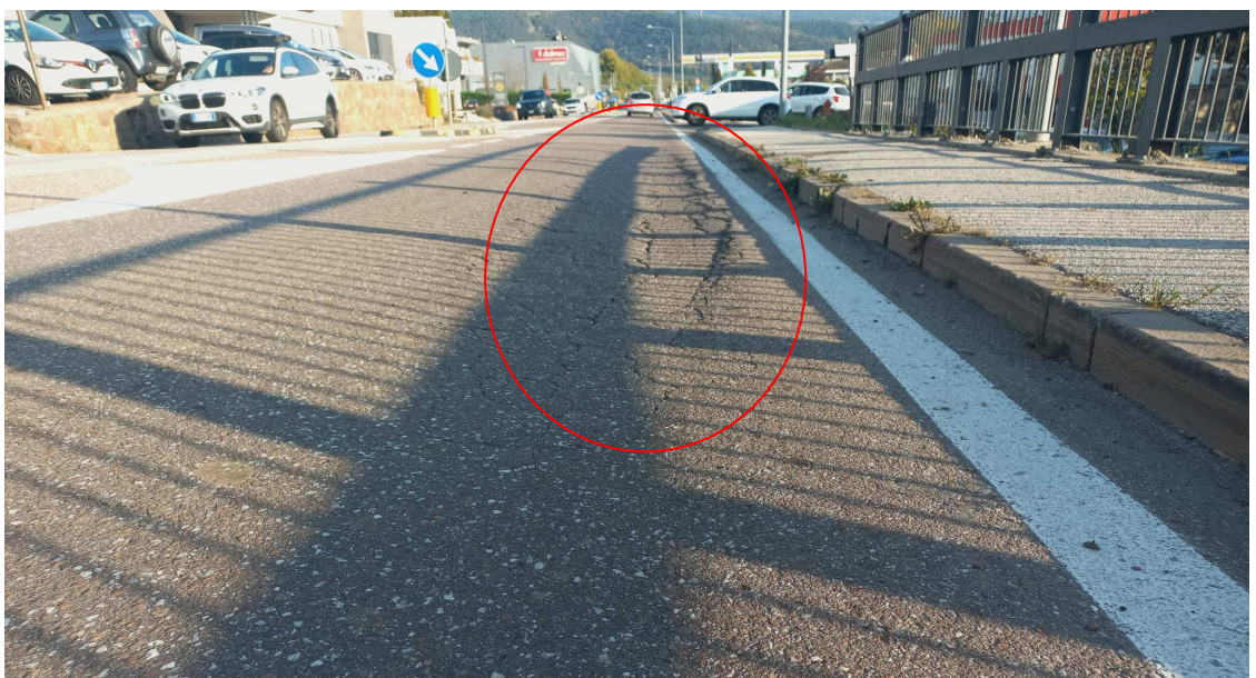
Foto n. 3 – SS43 ammaloramenti della pavimentazione in conglomerato bituminoso lungo Via Trento a Cles.