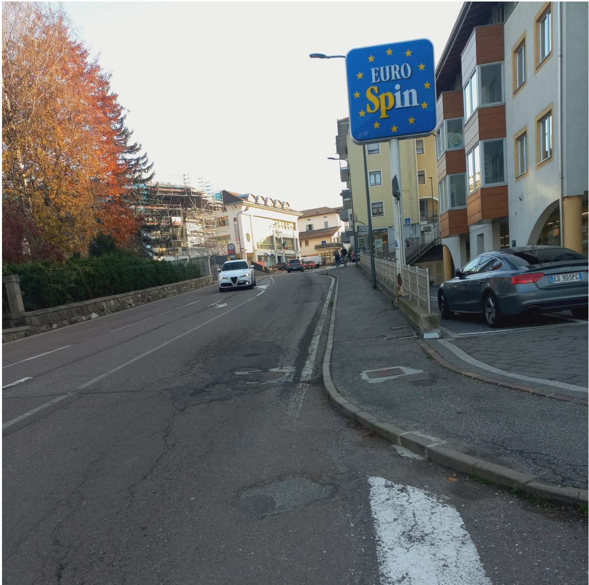
Foto n. 1 – SS43 ammaloramenti della pavimentazione in conglomerato bituminoso lungo Via Trento a Cles.