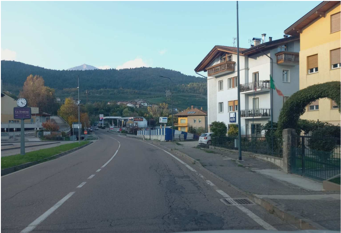
Foto n. 4 – SS43 ammaloramenti della pavimentazione in conglomerato bituminoso lungo Via Marconi a Cles.