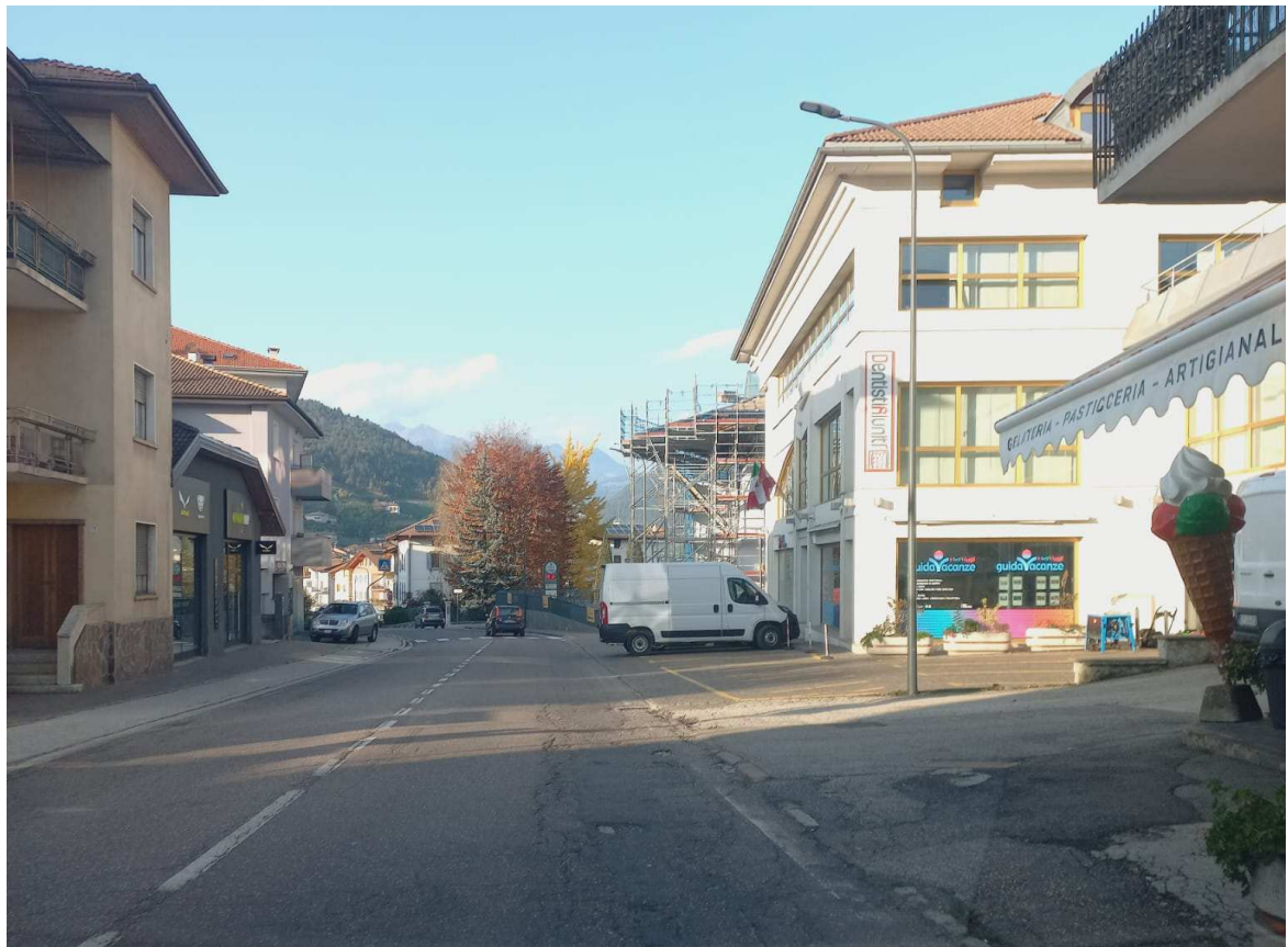
Foto n. 5 – SS43 ammaloramenti della pavimentazione in conglomerato bituminoso lungo Via Marconi a Cles