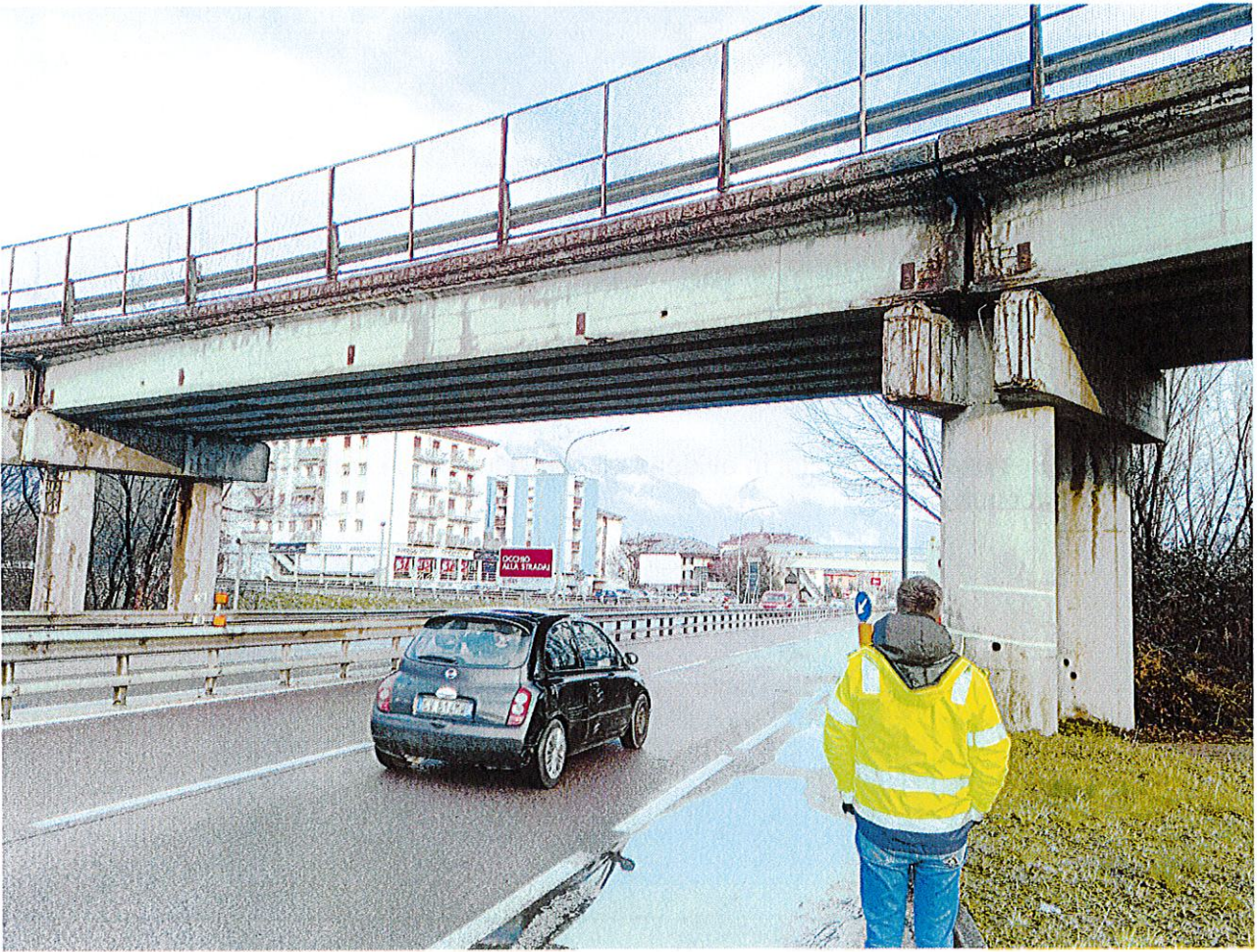
Foto1 - vista della campata a scavalco su Via Brennero a Melta di Gardolo