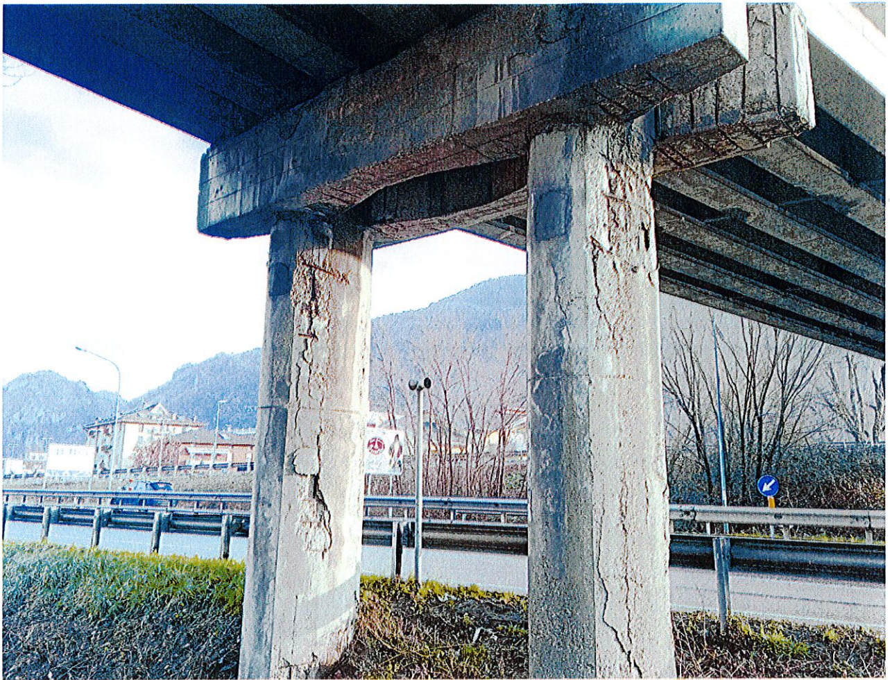
Foto 4 – vista delle pile e dell'avanzato stato di degrado della porzione corticale