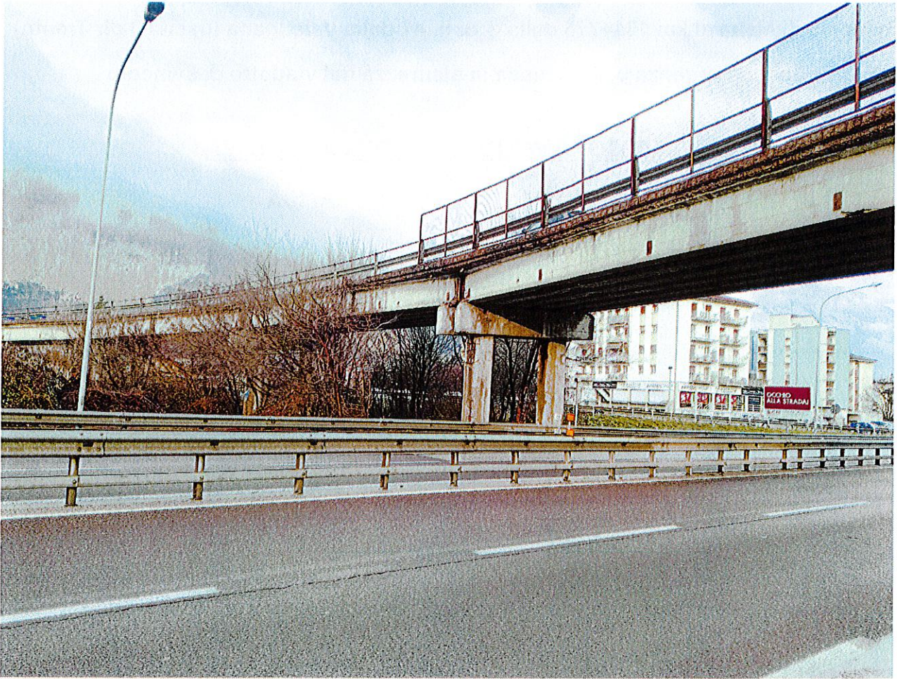
Foto 2 - vista più estesa del viadotto; in evidenza il degrado lungo i cordoli di bordo e in corrispondenza dei pulvini