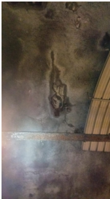
Foto n. 1-2 – nuovi apporti di acqua dalla volta della galleria Ponte Pià, a fianco di centine esistenti