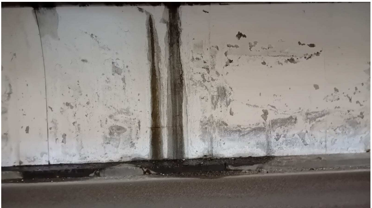
Foto n. 8-9 – ristagni sulla carreggiata e percolazioni sul marciapiede nella galleria Limarò