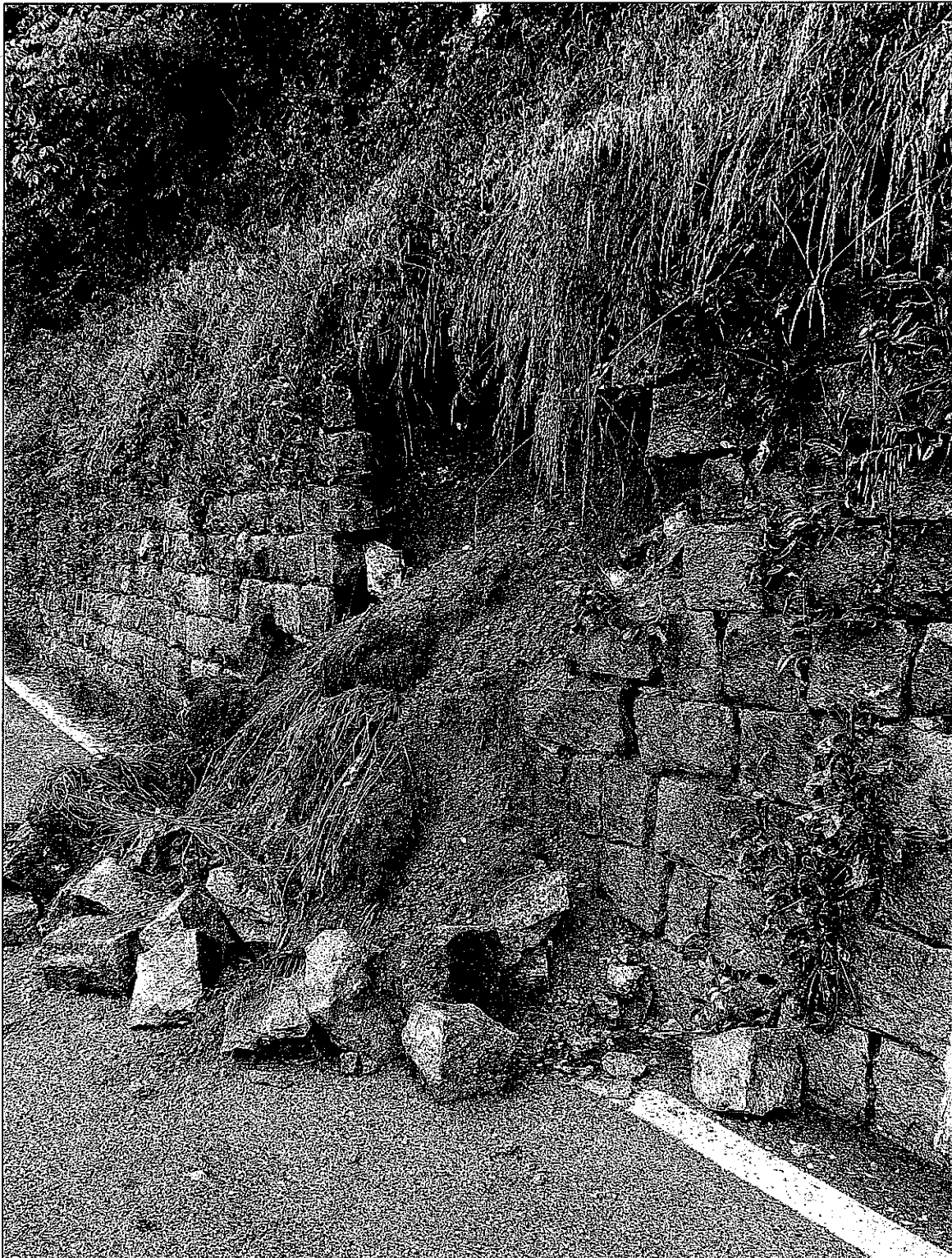
FOTO n. 1 – SP n 31 del passo Manghen nel comune di Telve Frana muro km 4+330