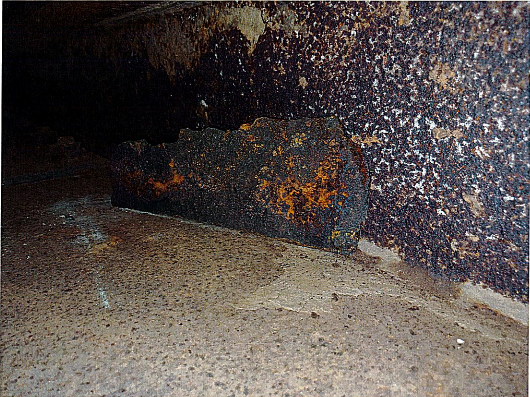
F02 – distacchi di ossido su ribs di fondo del cassone, campata 1