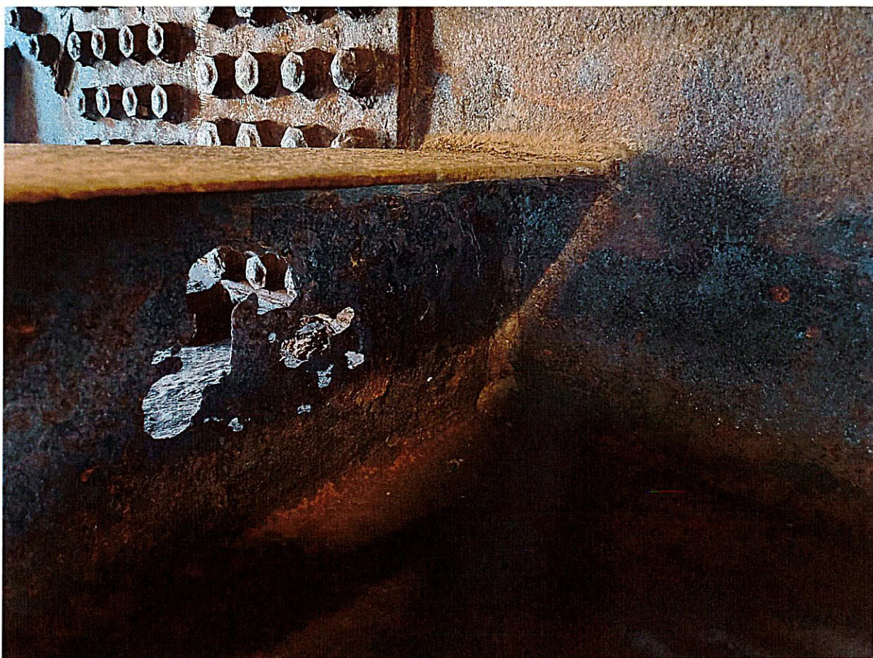
F01 – riduzione di sezione su ribs di fondo del cassone, campata 1