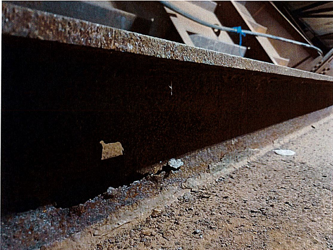
F03 – foratura dei ribs di fondo del cassone, campata 1, data dalla corrosione in atto