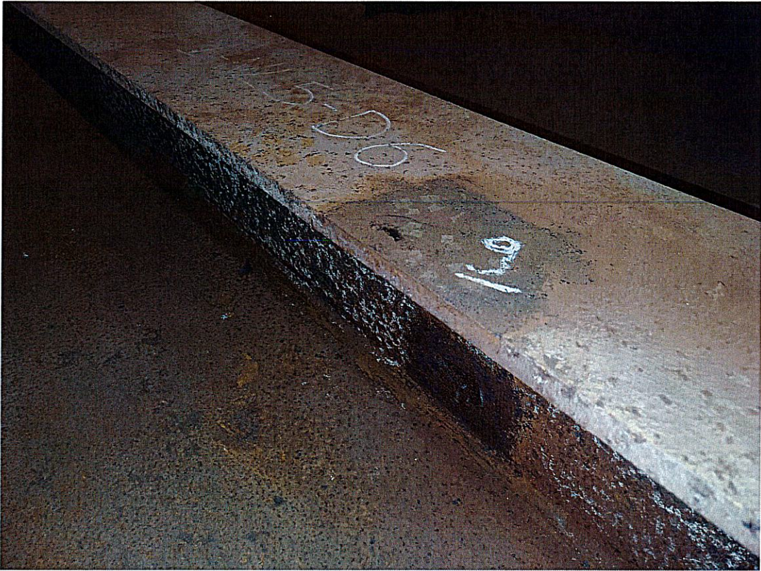
F04 – punti di misura su anima e ali dei ribs di fondo per la verifica degli spessori