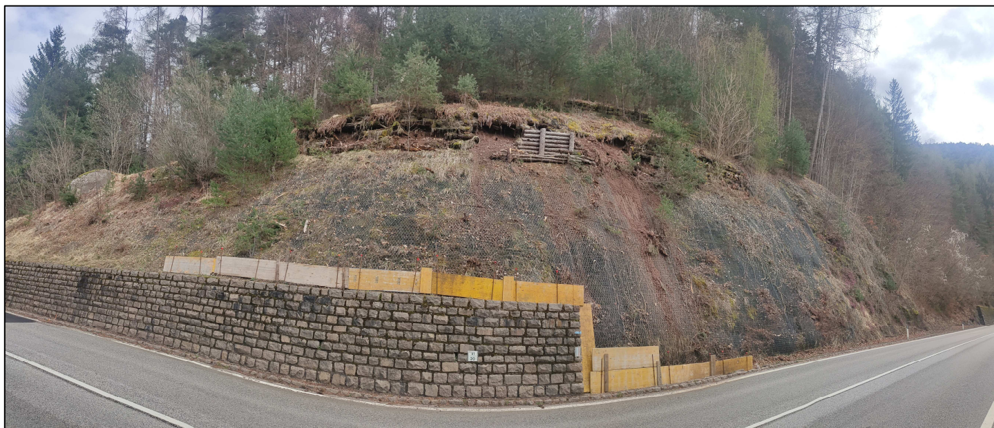
FOTO n. 1 – SP n. 71 Fersina-Avisio nel comune di Segonzano Cedimento arcia km 20+600