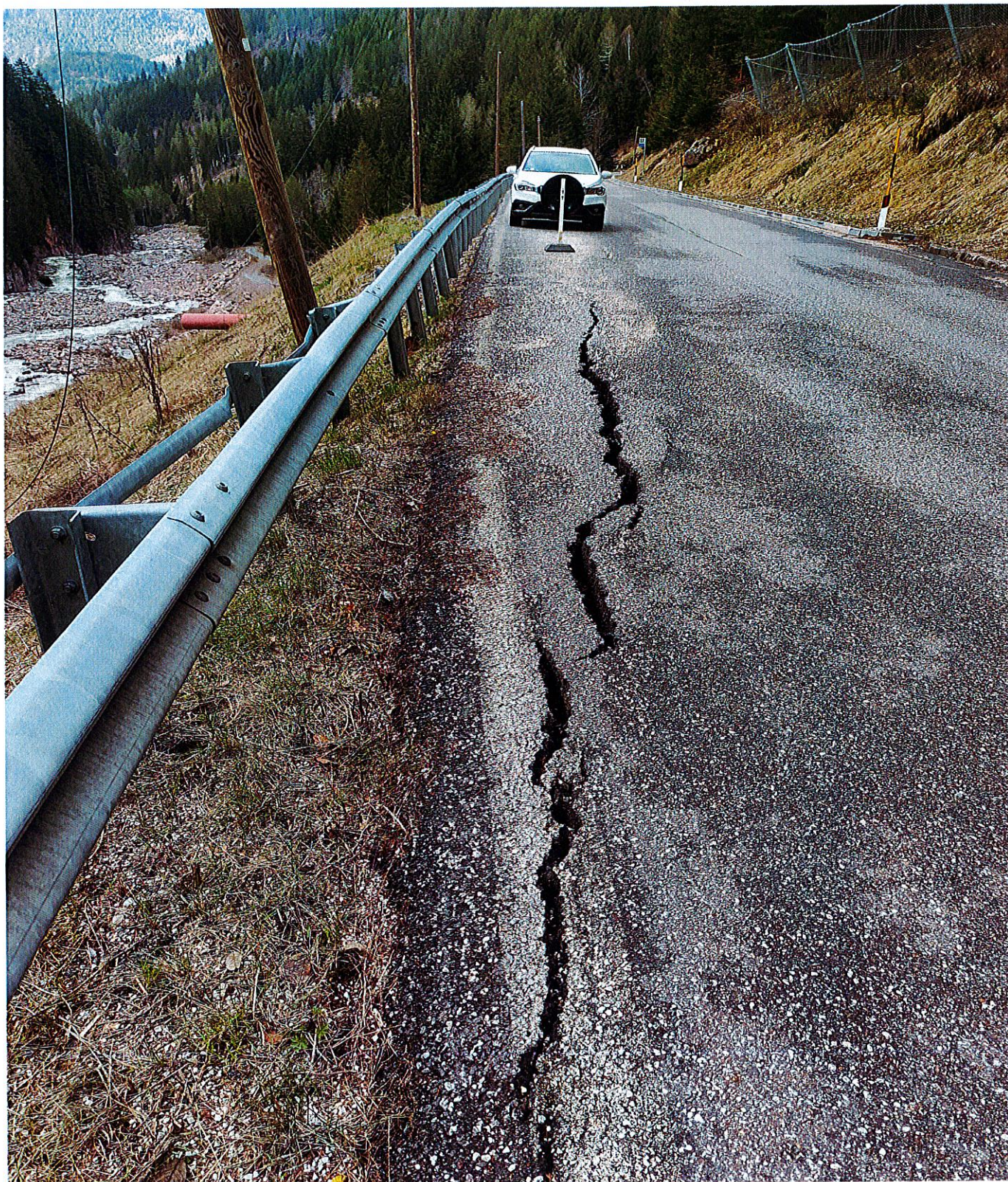
FOTO n. 5 – SP n. 31 del passo Manghen nel comune di Castello-Molina di Fiemme Cedimento banchina km 36+950