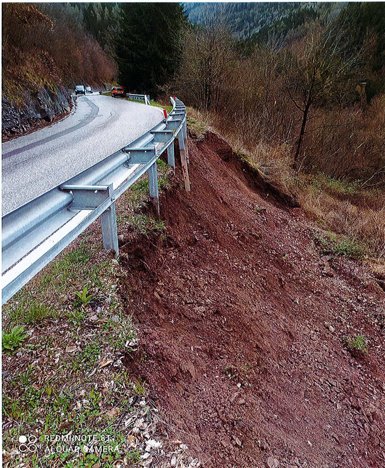
FOTO n. 3 – SP n. 71 Fersina-Avisio nel comune di Sover Cedimento banchina km 26+400