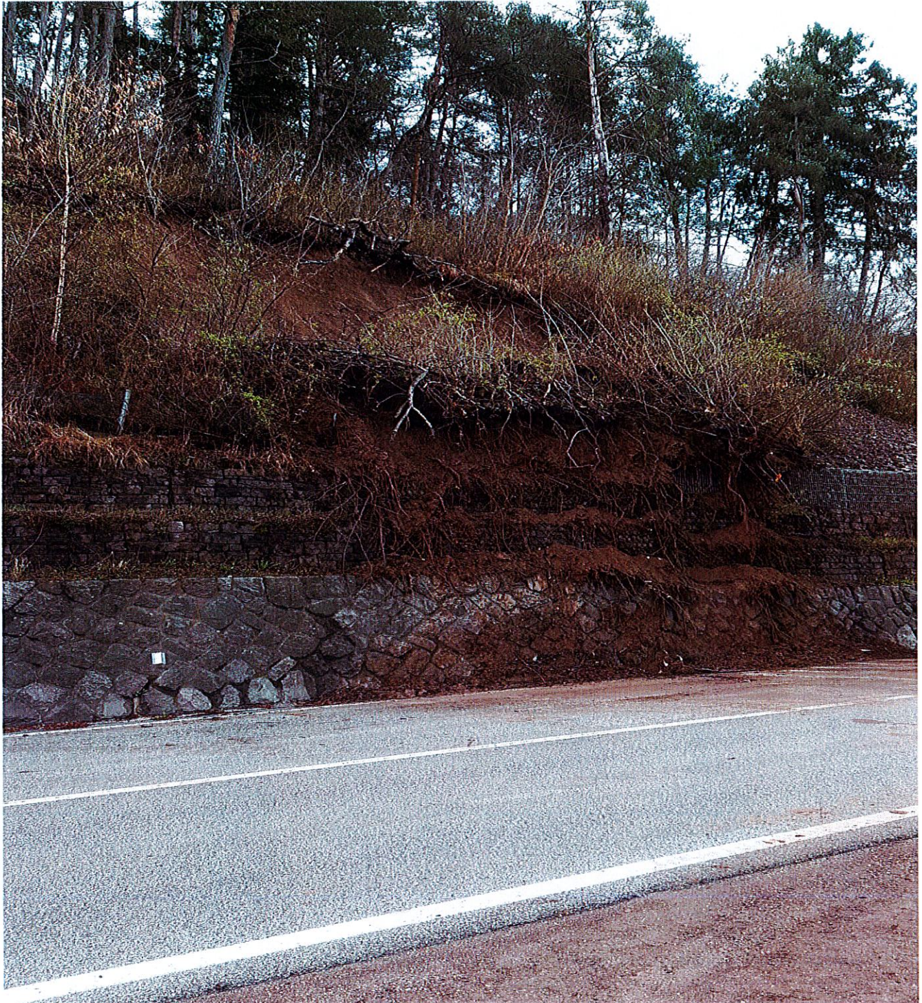
FOTO n. 1 – SP n. 71 Fersina-Avisio nel comune di Segonzano Franamento rampa km 15+500