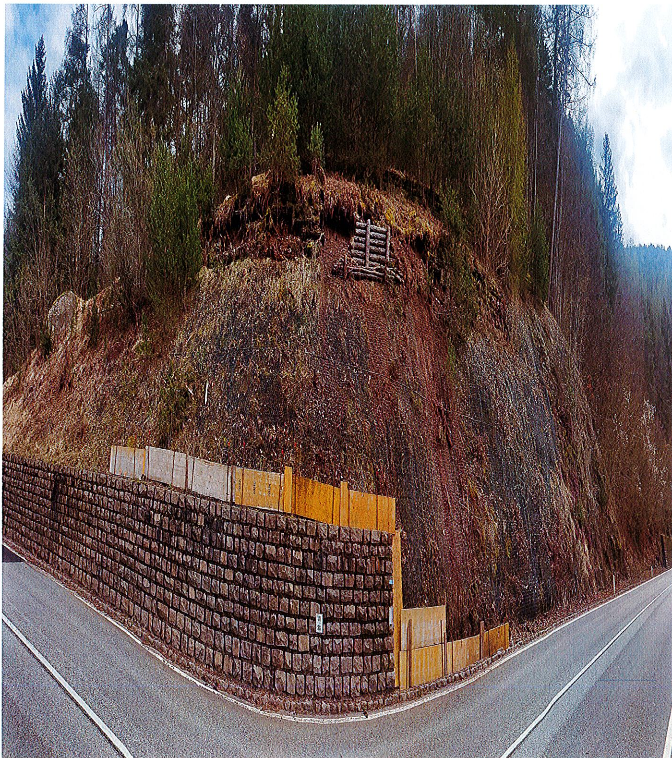
FOTO n. 2 – SP n. 71 Fersina-Avisio nel comune di Segonzano Cedimento arcia km 20+600